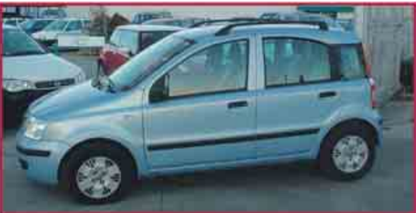
Fiat Panda 1.2 Dinamic Juny '08 Aire condicionat, CD, 6.800€