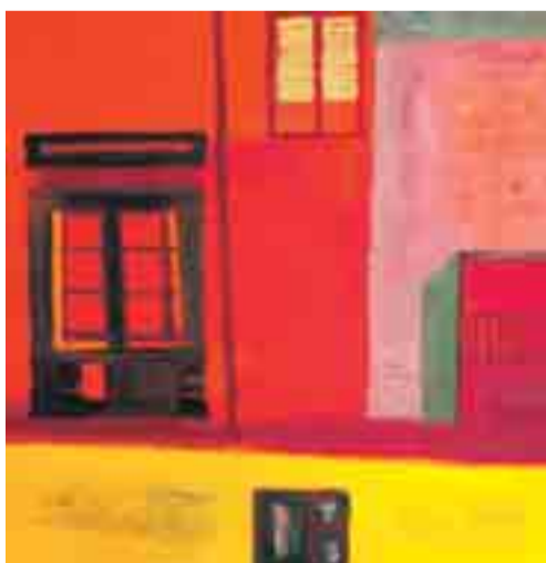
EU DALD CAMPS