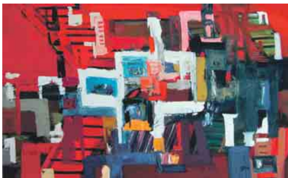
EU DALD CAMPS