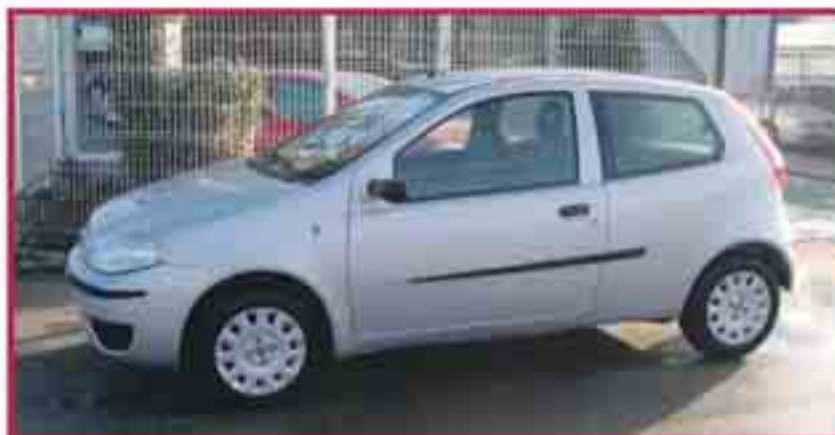
Fiat Punto 1.3 jtd Classic Per matricular Aire Condicionat, 2 Airbags 9.400 €