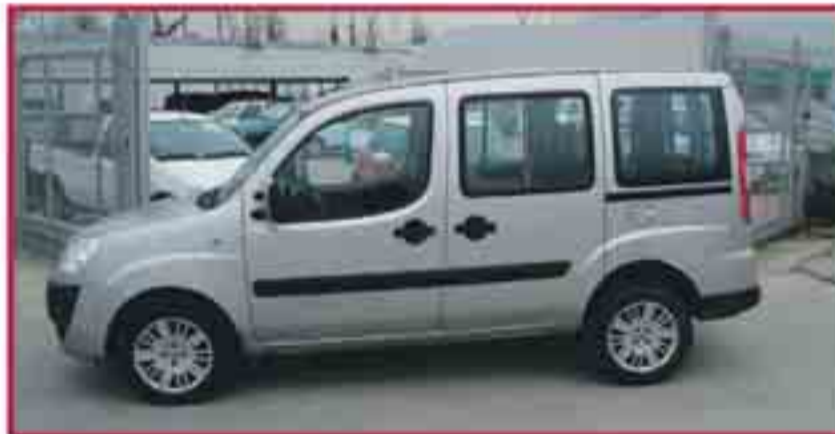
Fiat Doblo 1.9 jtd 105cv Dinamic Plus Desembre '07 Aire Condicionat, 2 Airbags 9.800 €

Pla 2000€ no inclòs, en cas de tenir un vehicle de + de 12 anys, es podrà descomptar un mínim de 1.000 €