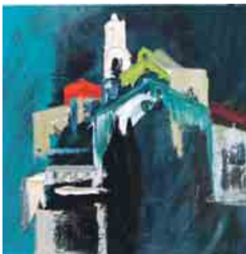
EU DALD CAMPS