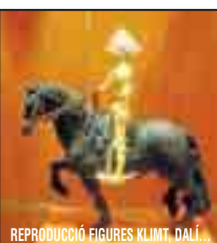
REPRODUCCIÓ FIGURES KLIMT, DALÍ...