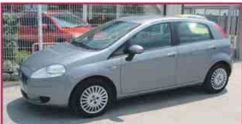
Fiat Grandepunto jtd 90cv Dinamic Maig '08 Clima Bizona, Blue&me USB, 6 Airbags 9.900 €