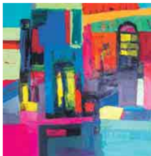
EU DALD CAMPS

questa argentina que sembla efinitivament establerta a Cadaqués.