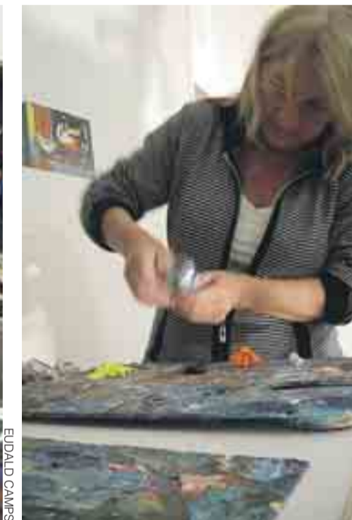
EU DALD CAMPS