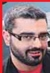
Eudald Camps Crític d'art