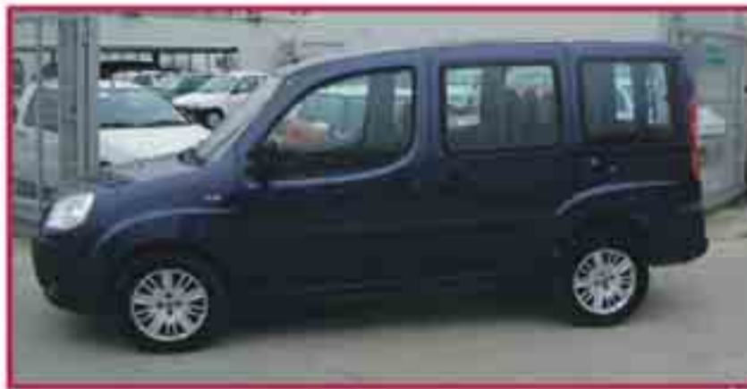
Fiat Doblo 1.9 jtd 105cv Dinamic Plus Maig '08 Aire Condicionat, 2 Airbags 10.450 €