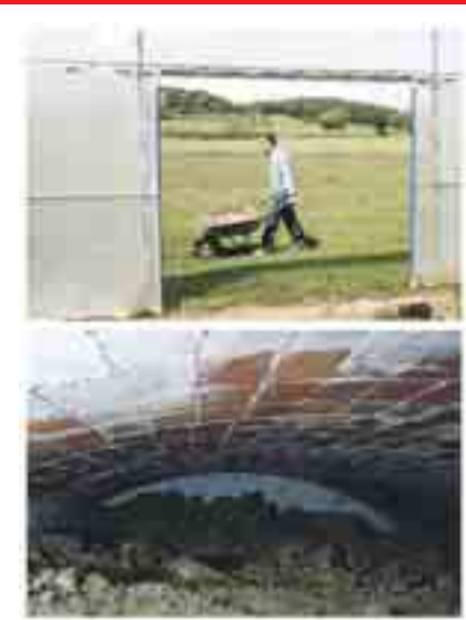
FOTO PORTADA: A DALT, UN DELS RESIDENTS AL MAS CASADEVALL, TREBALLANT A L'HORT; A BAIX, UN DELS PASSADISSOS DEL REFUGI DE LES BERNARDES, COL·LIGAT DE TERRA.