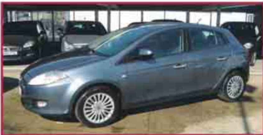
Fiat Bravo 1.9 jtd 120cv Dinamic Maig '08 Clima Bizona, Blue&me USB, 6 Airbags 11.900 €