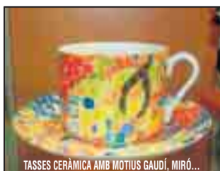
TASSES CERÀMICA AMB MOTIUS GAUDÍ, MIRÓ...