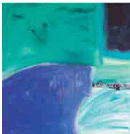
EU DALD CAMPS