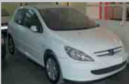
Peugeot 307 XS 2.0. 16v. A/C. Equip elèctric. Full equip. Any 01. 9.500 e.