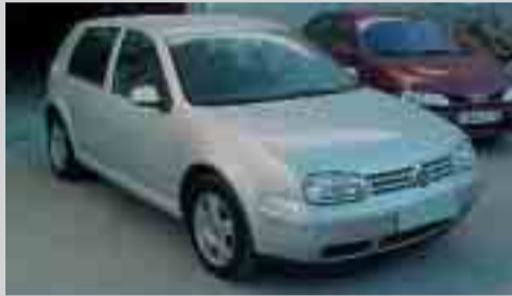
Volkswagen Golf 1.6. 4 p. A/E. T/C. D/A. A/C. Llandes. Any 99. 9.000 e.