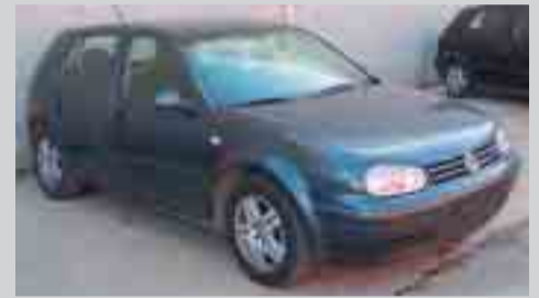
Volkswagen Golf 1.9 TDI Confort Line. 115 cv. 5p. A/C. D/A. A/E. T/C. Llandes. Any 00. 9.500 e.