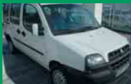
FIAT DOBLO 1.9 DS COMBI - '01 - 7.200 € D.A., T.C., AIRBAG, A.E