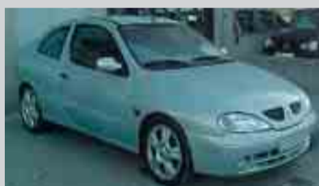
Renault Megane Cupè 2.0 i. ABS. A/C. D/A. A/E. Llandes. CD. Any 00. 7.500 e.