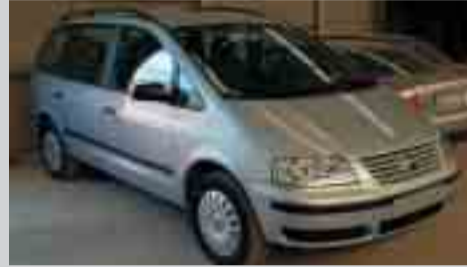
Volkswagen Sharan 1.9 TDI Concept Line. 115 cv. Clima. CD/MP3. Full equip. Any 03. 19.000 e.