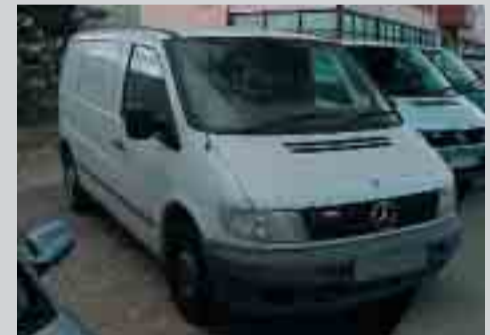
Vito furgó 112 CDI. D/A. A/C. Any 02. 13.500 e.