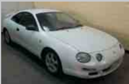
Toyota Celica. A/C. Equip elèctric. Any 99. 7.000 e.