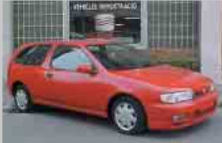
Nissan Almera 1.6. 3 p. A/C. Equip elèctric. Any 98. 5.350 e.