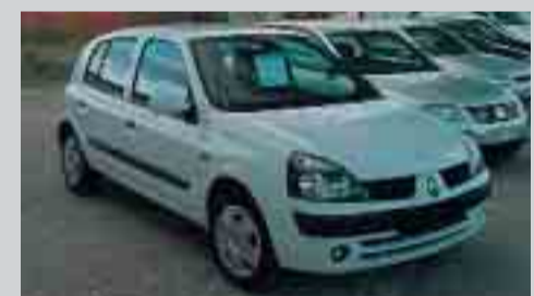
Renault Clio 1.5 DCI. 5 p. Full equip. 8.900 e.