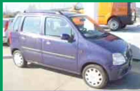
OPEL AGILA - '02 - 5.400 € D.A., T.C., A.E.