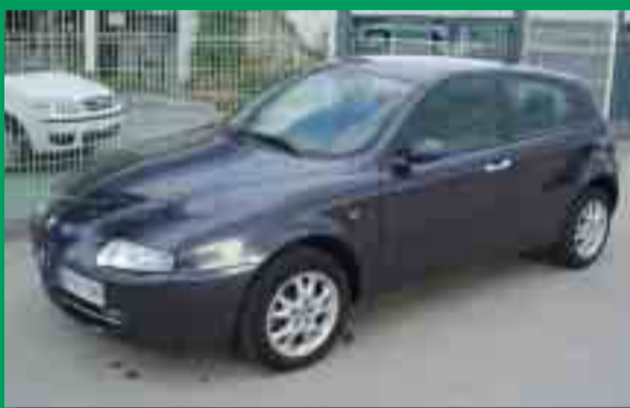
ALFA 147 5P JTD 115 DISTINTIVE - '03 - 15.700 € FULL EQUIP