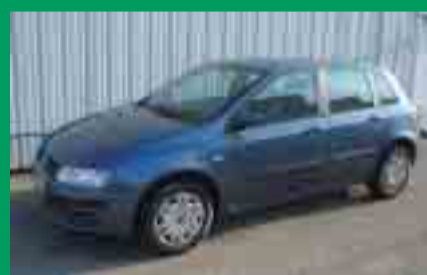
FIAT STILO 5P JTD 115CV - '03 - 12.900 € ABS. 6 AIRBAGS. A.C., D.A., T.C., A.E.