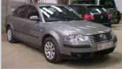
Volkswagen Passat 1.9 TDi. 130 cv. Clima. R/CD. Airbags. T/C. D/A. Any 01. 18.000 e.