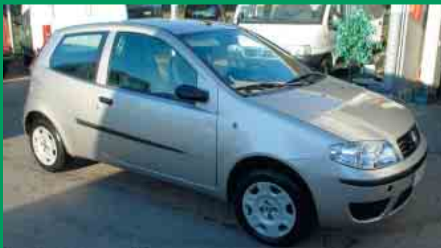
FIAT PUNTO 1.2 3P - '04 - 8.390 € A.C., D.A., A.E., ABS AIRBAG