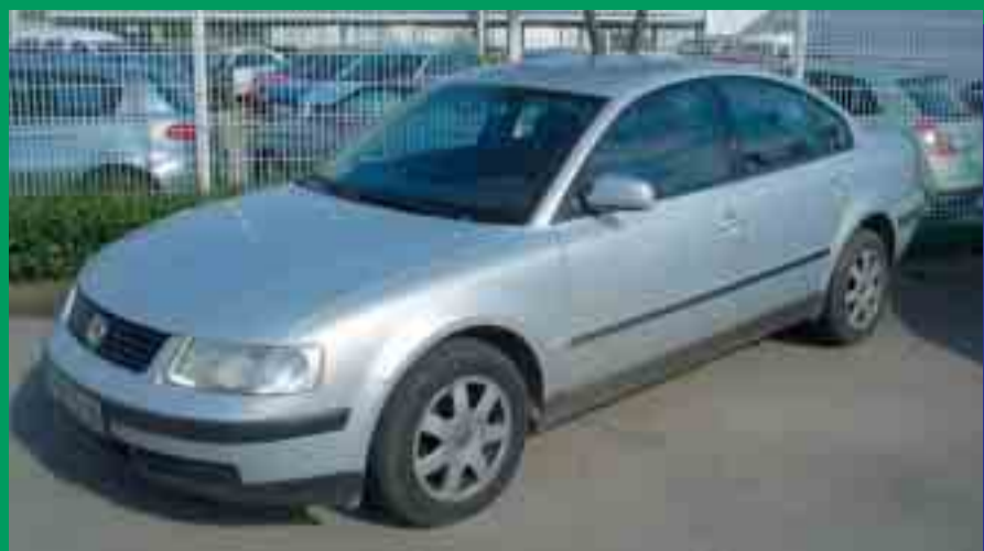
VOLKSWAGEN PASSAT TDI 110 - '99 - 12.990 € FULL EQUIP, PELL, NAVEGADOR