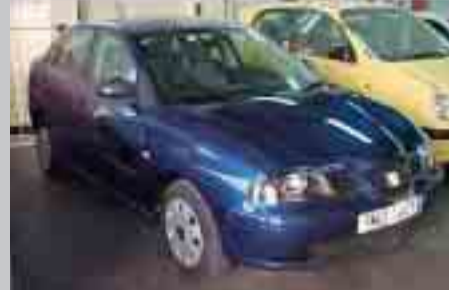
Seat Cordoba Stella. 16V. 75 cv. Full equip. Any 03. A consultar.