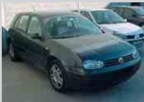
Volkswagen Golf 1.9 TDI. 110 cv. 5 p. D/A. A/E. T/C. Any 01. 12.000 e.