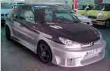
Peugeot 206 XS 1.6 Tunning. 110 cv. Full equip. Any 01. 8.500 e.