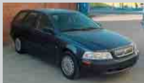
Volvo V40 TDI. 115 cv. Any 01. A/C. D/A. T/C. A/E. 13.000 e.