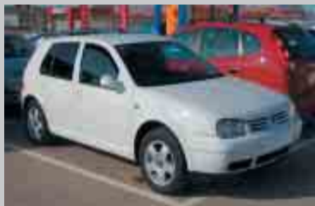
Volkswagen Golf 1.6. 100cv. 5p. D/A. A/E. T/C. A/C. R/C. Llandes. Antiboires. ABS. Any 98. 6.000 e.