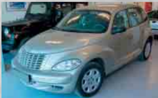
PT Cruisser 1.6 i Classic. Any 05. 14.500 euros.