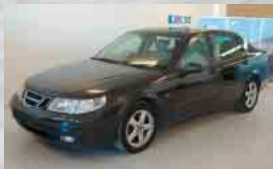
Saab 3.0 TDI V6. 95cv. Full equip. Any 03. 17.500 euros.