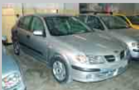
Nissan Almera 1.8. 105cv. Full equip. Any 00.