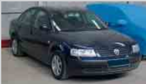
Volkswagen Passat 1.9 TDI. 115 cv. Clima. A/E. T/C. D/A. Any 00. 13.500 e.