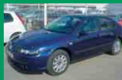
SEAT LEON TDi 110 - '01 - 11.900 € A.C., AIRBAGS D.A., T.C., ABS