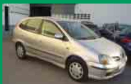
NISSAN ALMERA TINO 2.2 TD - '01 - 12.600 € ABS. 4 AIRBAGS. A.C., D.A., T.C., A.E.