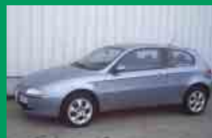
ALFA 147 1.6 3P 120CV - '01 - 12.300 € FULL EQUIP