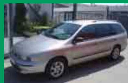
FIAT MAREA 1.6 SW - '01 - 8.800 € 2 AIRBAGS. CLIMA. D.A., T.C., A.E. LLANTES