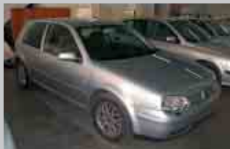
Volkswagen Golf GTI 1.8. 150cv. Xenon. Full equip. CD. Any 00.