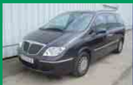
LANCIA PHEDRA 2.2 JTD - '03 - 24.000 € FULL EQUIP