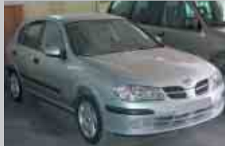
Nissan Almera 1.8. D/A. Doble airbags. Any 01. A/C. 5.600 e.