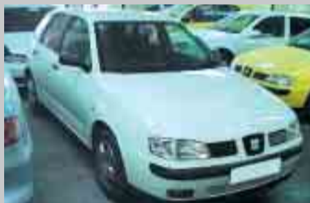
Seat Ibiza 1.9 TDI. 90cv. A/C. T/C. D/A. A/E. R/C. Any 99. 2 airbags. A consultar.