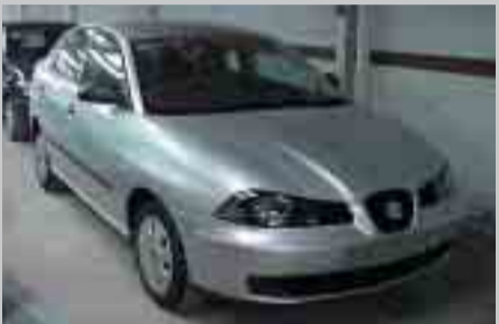
Seat Cordoba Stella 1.4 i. 75 cv. A/C. R/CD. Equip elèctric. 4 Airbags. Any 05. 12.300 e.