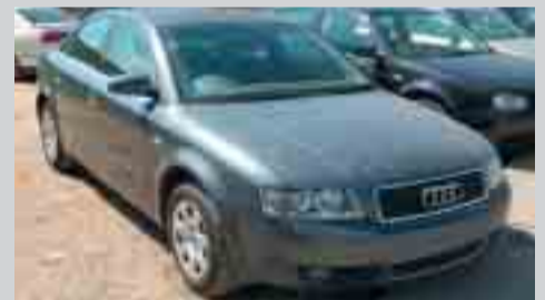
Audi A4 1.9 TDI. 130 cv. Clima. 6/CD. Full equip. Acabats en fusta. Any 01. 15.000 e.