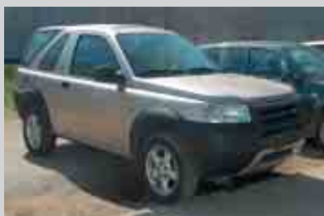
Land Rover Freelander TD4. Full equip. Any 02. 16.500 e.