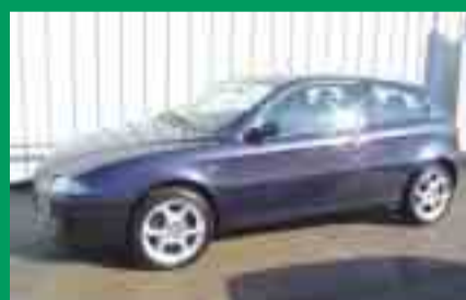
ALFA 147 2.0 SELESPEED - '01 - 11.800 € CANVI SEQUENCIAL, FULL EQUIP