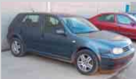
Volkswagen Golf 1.9 TDI Highline. 115 cv. 5p. A/C. D/A. A/E. T/C. Llandes. Any 00. 9.500 e.