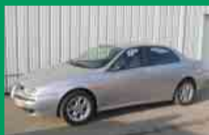
ALFA 156 1.9 JTD DISTINTIVE - '03 - 12.300 € CLIMA, LLANTA 16, PACK SPORT