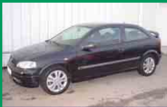
OPEL ASTRA 1.9 DTI 3P - '00 - 7.400 € A.A., D.A., T.C., LLANTES