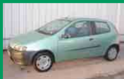
FIAT PUNTO 1.2 3P ACTIVE - '00 - 5.900 € A.A., D.A., T.C., A.E.