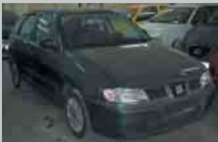
Seat Ibiza 1.9 TDI Stella. D/A. A/E. Doble airbags. Autoclima. Any 99. 5.500 e.