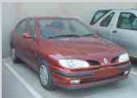
Renault Megane Alizè Classic. Any 98. Full equip. € 6.500. 6.000 e.