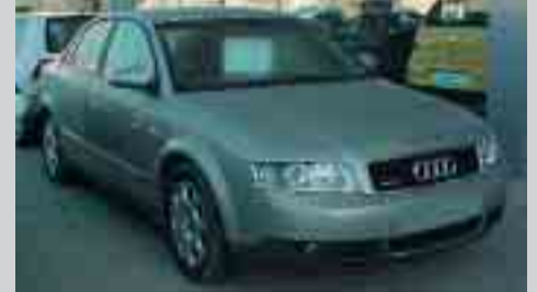
Audi A4 3.0 V6 Quattro. 220 cv. Full equip. Any 02. 19.500 e.