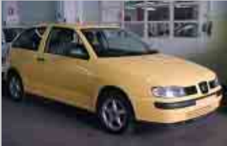
Seat Ibiza 1.9 TDI Stella. 3 p. A/C. E/E. R/C. Doble airbags. Any 02. 8.400 e.