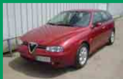
ALFA 156 1.9 JTD SW DISTINTIVE - '03 - 17.800 € FULL EQUIP