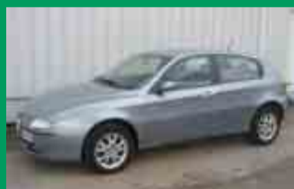
ALFA 147 1.6 3P - '02 - 11.300 € AIRE, LLANTES