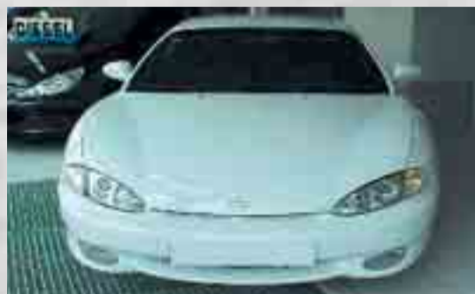
Hyundai Coupé FX 2.0. Full equip. Any 98. 5.400 euros.