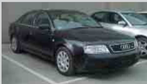
Audi A6 1.8 T Quattro. 150 cv. Airbags. Full equip. Acabats en fusta. Navegador. Any 99. A consultar.