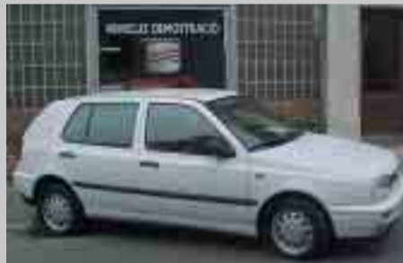
Volkswagen Golf 1.6 CL. 5 p. A/C. D/A. R/CD. Any 96. 5.500 e.