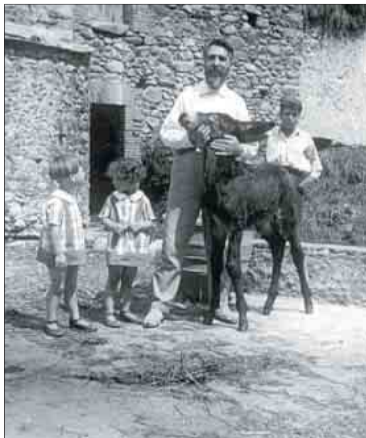
Masó en el mas Bru de Domeny, el 1926.

L'any 1912, de retorn de seu viatge de nuvis per Àustria i Alemanya, enceta un segon període que durarà fins al 1922 i en el qual reforça la seva actitud inicial de definir un estil propi. És el moment de les obres plenament noucentistes, que es considera el més interessant de la seva trajectòria. Durant aquest segon període Rafael Masó projecta les cases que han esdevingut referència en l'arquitectura catalana del moment: l'edifici Athenea, les cases Cendra, Masramon, Ensesa, Cases i Teixidor, el garatge Callicó i la Casa Gispert Saüch.