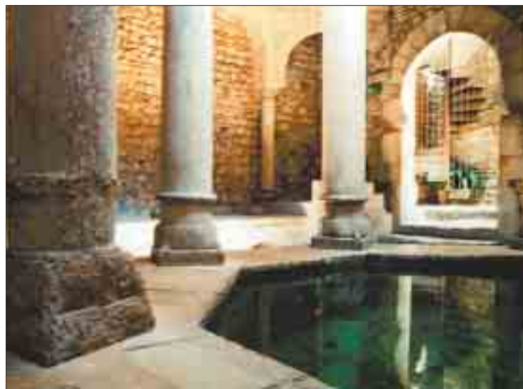
Masó va restaurar els Banyes Àrabs.

En l'apartat d'obres religioses destaca l'altar de la Puríssima, la pica d'aigua beneïda i l'altar major de l'església de les Josefines (1907). El 1925 va portar a terme la reforma de la capella de la Confraria de la Passió i Mort a l'església de Sant Feliu; així com la restauració dels Banyes Àrabs del