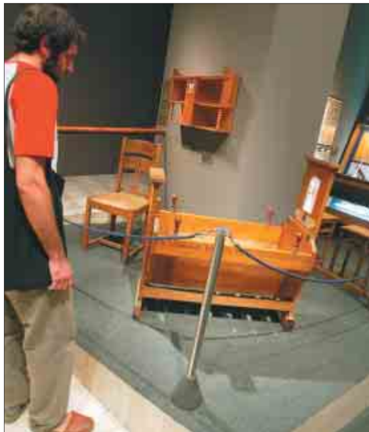
Visitants de l'exposició al Museu del Cinema, que s'ha prorrogat.