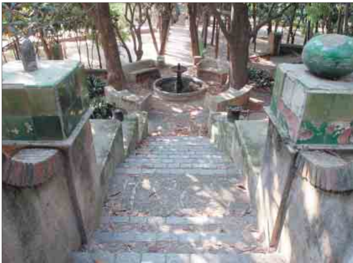
Part dels jardins de Can Cendra.