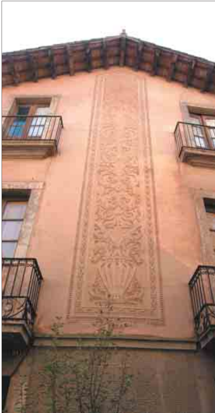
Detalls esgrafiats de la façana principal de Can Cendra.

L'ampliació de la casa consta d'uns cossos que salven el desnivell entre el jardí i el casal i que constitueixen la nova façana del