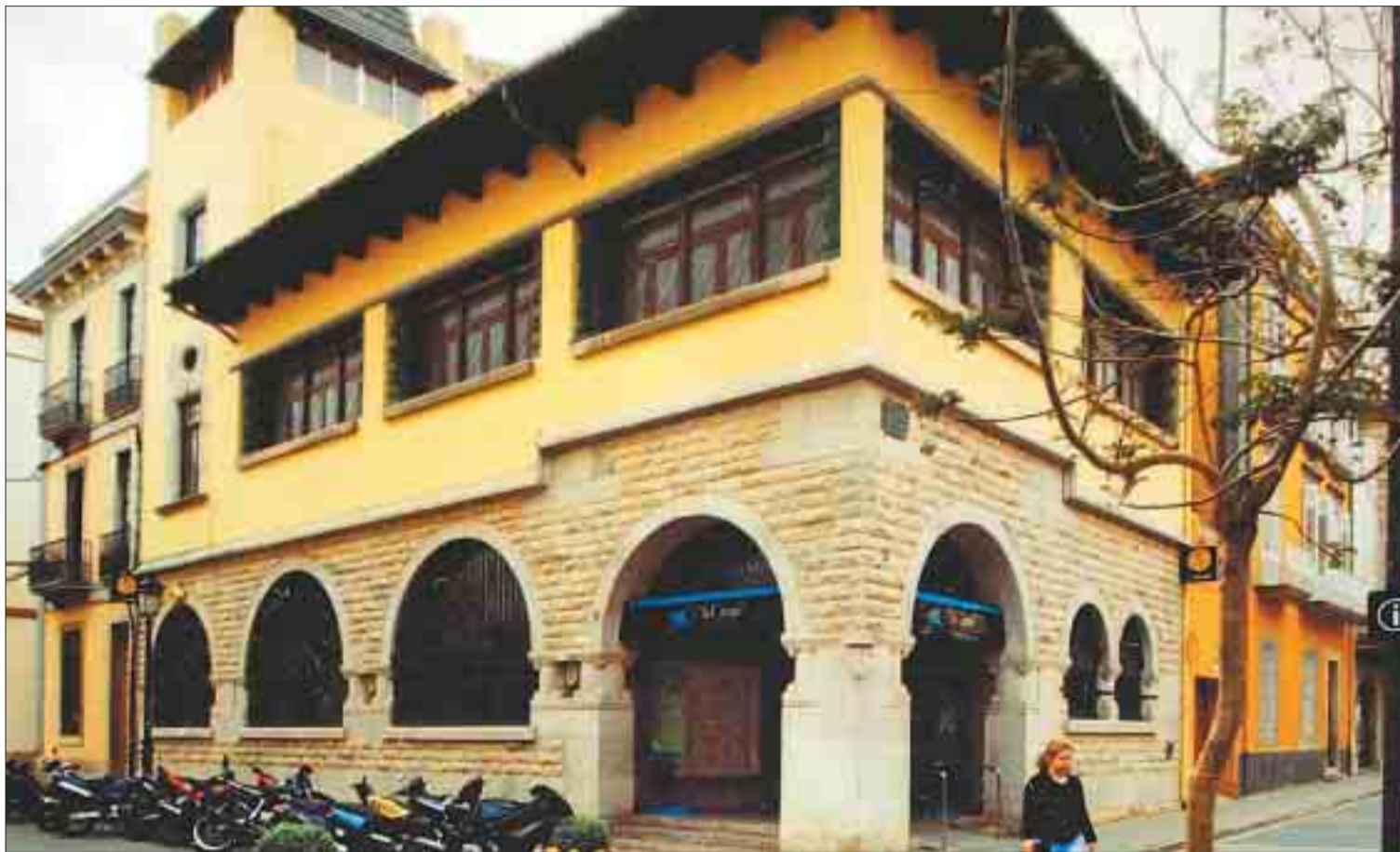
Foto històrica de l'edifici de La Caixa, a Sant Feliu de Guíxols.

La reforma del Mas El Soler – a la carretera de la Font Picant – de Sant Hilari Sacalm és una altra obra catalogada. Es tracta d'una antiga masia de cinc plantes, amb galeries obertes a migdia i construïda amb pedra del país. Les obertures de la façana estan em-