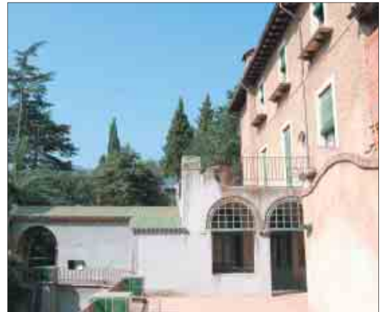
Una altra imatge de l'exterior de Can Cendra.