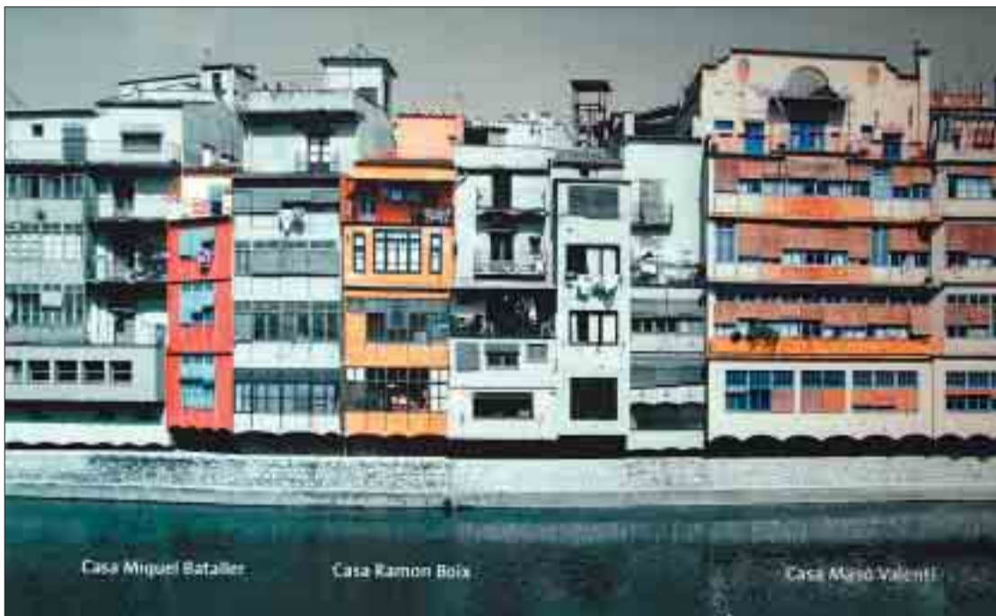
En color, tres cases de l'Onyar a on va intervenir l'arquitecte: Bataller, Boix i Masó Valentí.

La Casa Teixidor està a la c/ Sta. Eugènia, 19, coneguda popularment com a Casa de la Punxa, en referència a l'element més con-