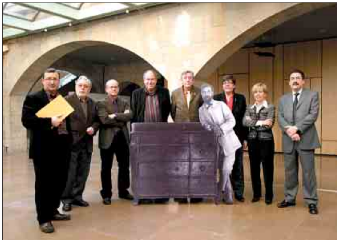
PAGINA OFICIAL ANY MASÓ

Geografia de Rafael Masó, l'arquitecte i les comarques gironines és la mostra itinerant que, organitzada per la Diputació de Girona, vol oferir una visió de l'arquitecte clarament arrelat a les comarques de Girona. La intenció es presentar un arquitecte que va més enllà de la ciutat de