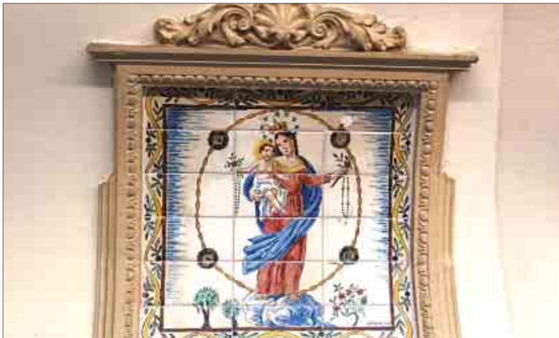
Mosaic amb imatge religiosa de Can Cendra, a Anglès.

Sant Feliu de Guíxols compta actualment amb tres exemples del treball del gironí. El 1934 va portar a terme la reforma de la Casa Sibils (antiga Casa Pedrieux). La