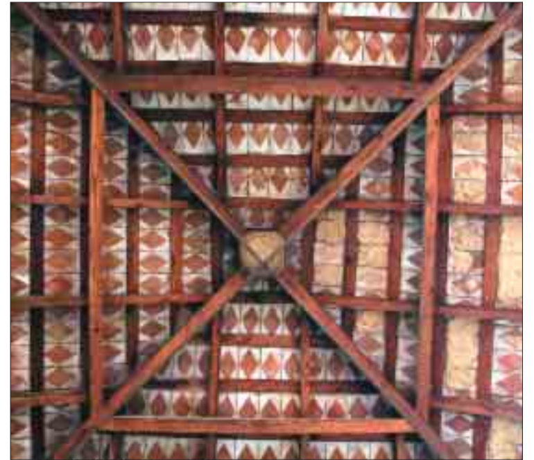
Cúpula de la glorieta de la terrassa de Can Cendra.