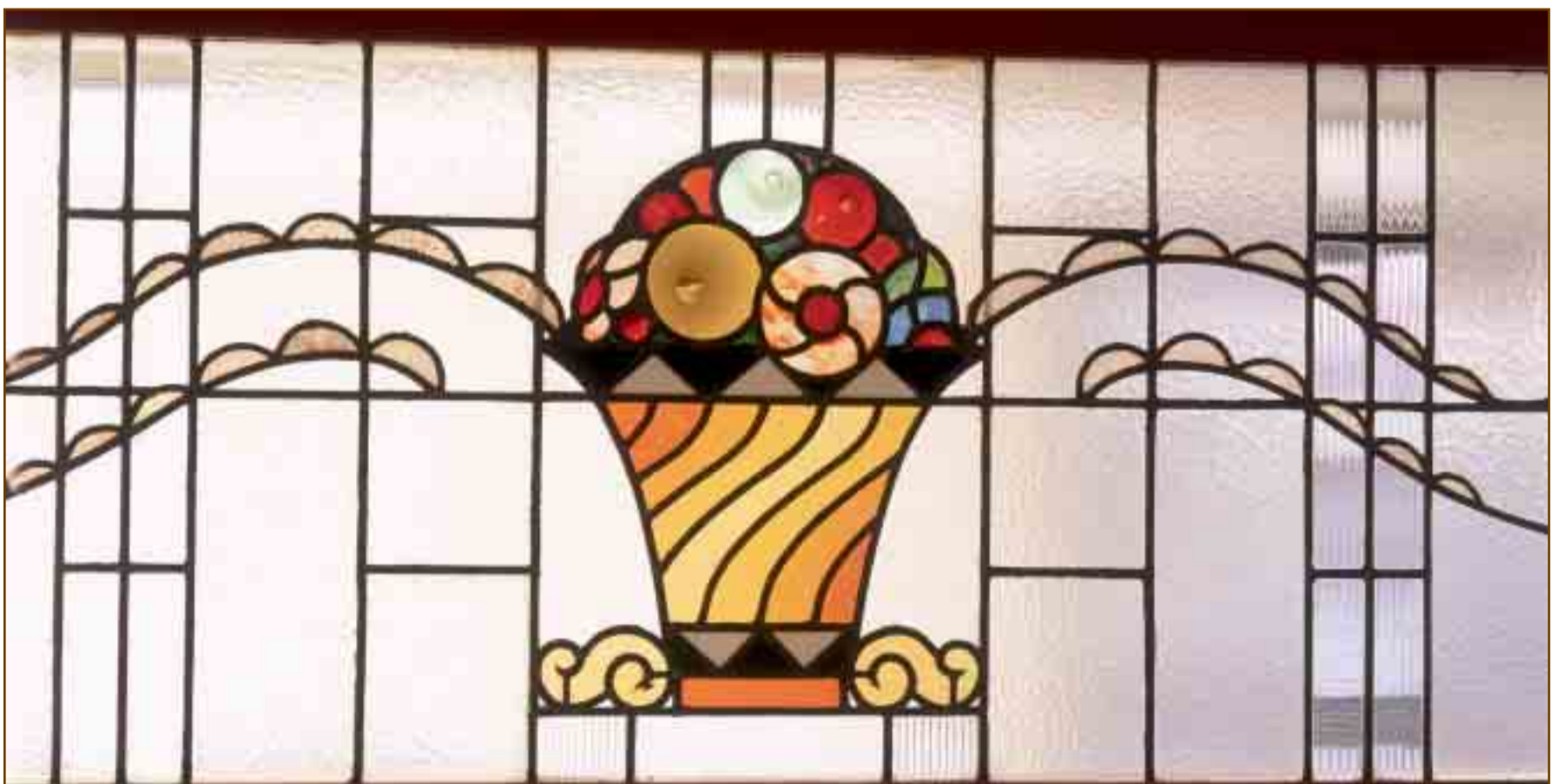
Vitrall original de Rafel Masó - Casa Teixidor - La Punxa

Pel que fa a l'Alt Empordà es conserva la Casa Coll de Borrassà que va reformar entre el 1909 i el 1910; i també cal destacar l'interior de l'església de la localitat que va ser reformat el 1925. A Garriguella també es conserva el Panteó Solà (1909), ubicat en el cementiri de la població.