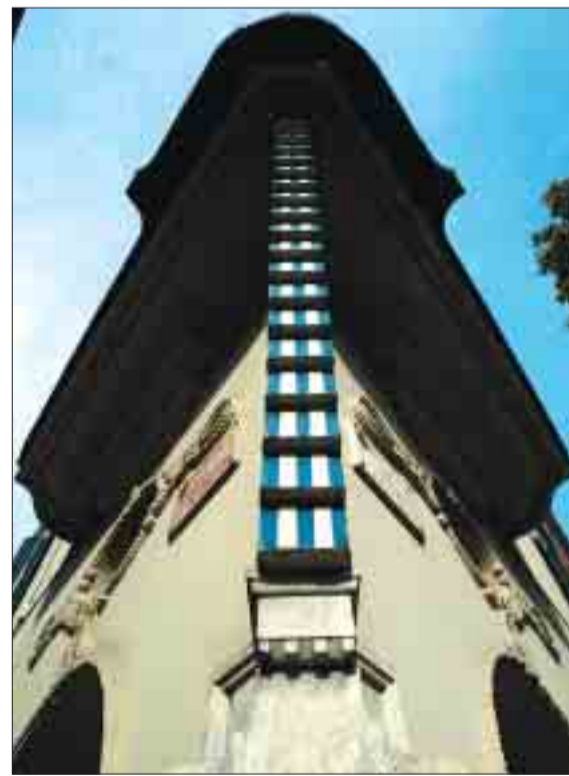
Casa de Joaquim Colomer.